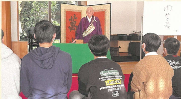
清水寺・貫主様からの講話