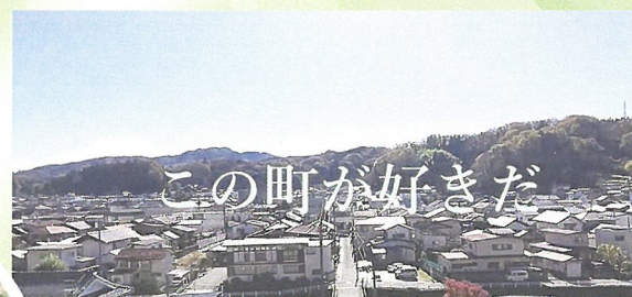
④完成した動画の一部