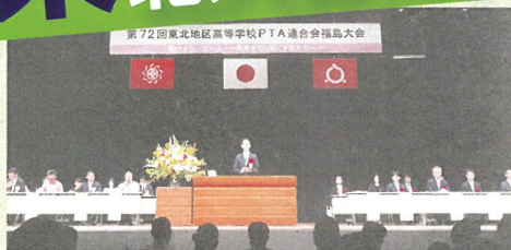
パルセいいざかで開催された福島大会

7月6日(木)～7日(金)にパルセいいざかで開催された、PTA東北大会に、本校PTAも、役員や一般参加という形で携わりました。