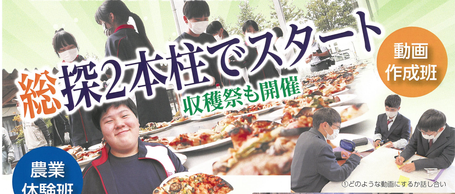
①どのような動画にするか話し合い