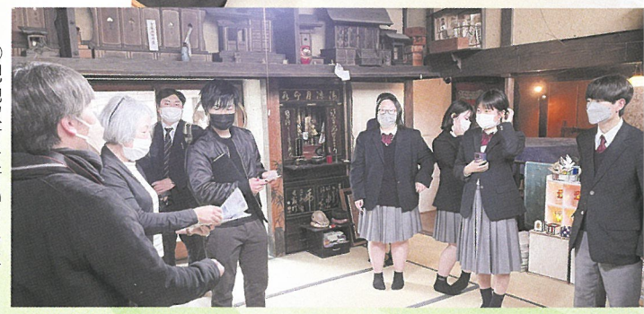
②現地取材を行いました (旧高橋家住宅)